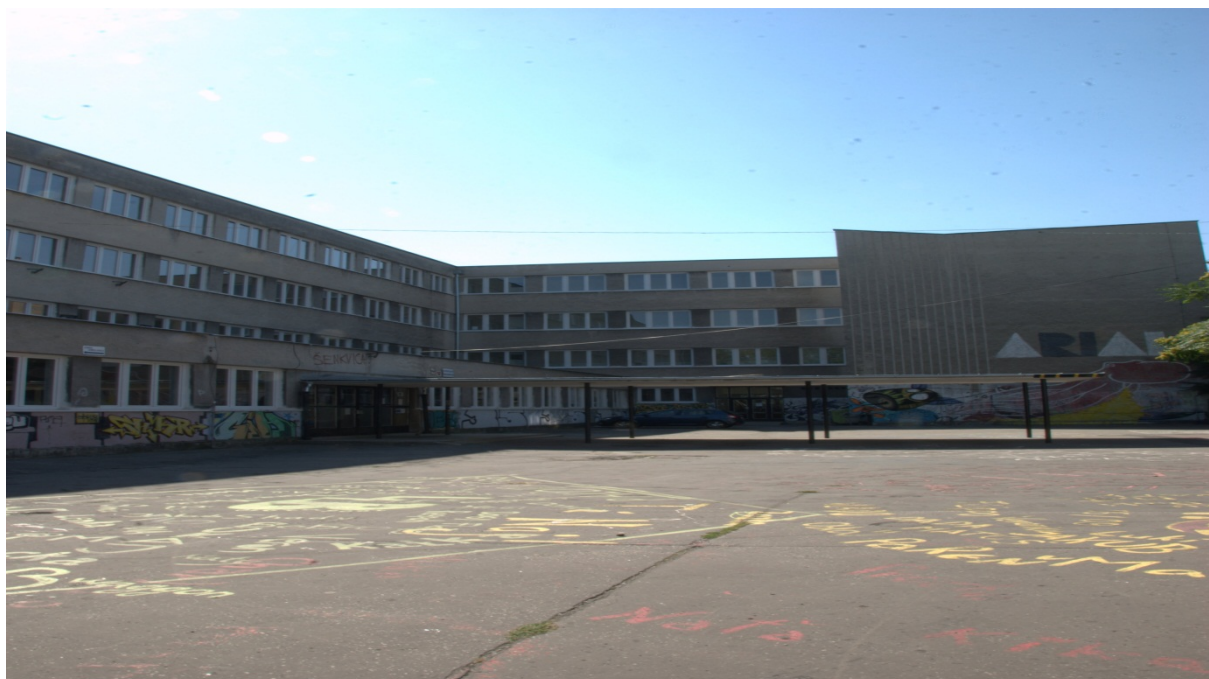
budova súpisné číslo 25 – mimoškolský pavilón – telocvičňa